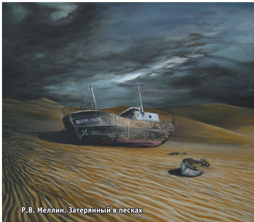
Р.В. Меллин. Затерянный в песках