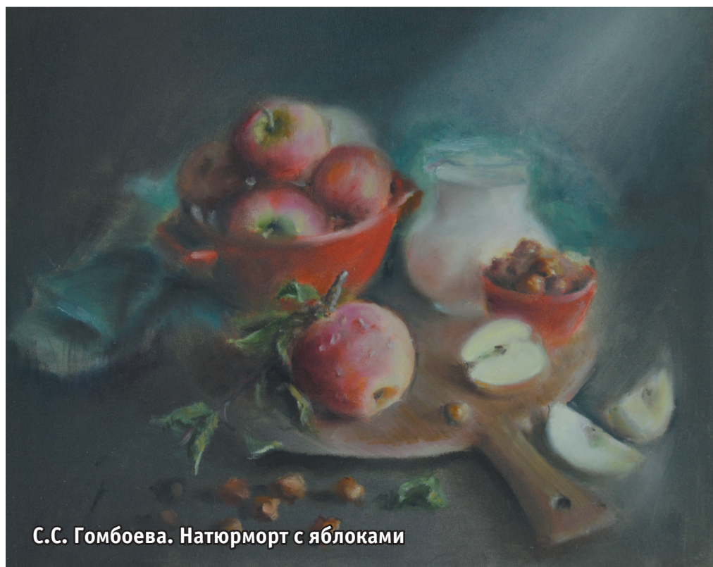
С.С. Гомбоева. Натюрморт с яблоками