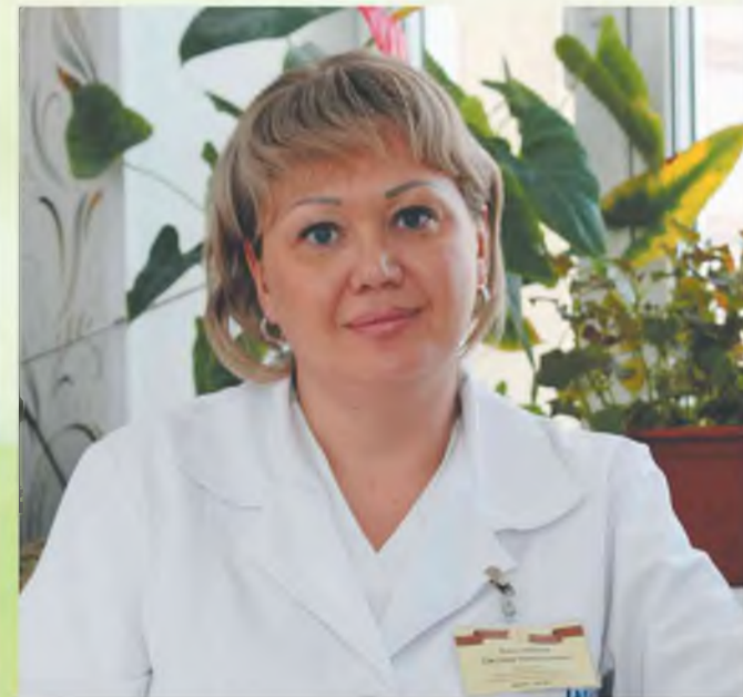
Мы любим украшения

– Даже самая сложная работа не убивает женственность. Когда уходишь в операционную на весь день, от косметики мало что остаётся. Сегодня есть много возможностей в индустрии красоты, чтобы выглядеть хорошо, и мы их успешно используем. Конечно, в операционной никаких длинных ногтей, яркого макияжа, украшений на руках. Это неуместно в нашем деле. Мы ходим в «тихой» обуви. Я отвыкла от халатов, предпочитаю ходить в медицинском костюме, тем более, что их цветовая гамма разнообразна.