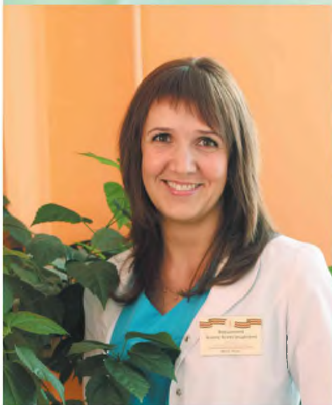
Белый халат усиливает макияж

Сегодня в гостях у «Первой клинической» женщины, которые всегда в форме. Это звучит странно, ведь большинство сотрудниц нашей больницы в форме – в халатах и хирургических костюмах. Но наши гости знают секрет, как сохранить свою привлекательность, индивидуальность, чем подчеркнуть природную красоту, несмотря на часы, проведённые в операционных, ночные дежурства и ежедневную работу.