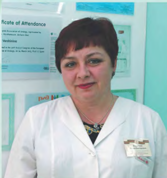
У женщин свои секреты

Безупречной чистоты халат – вот что сразу вызывает к медицинскому работнику симпатию и уважение. Я всегда говорю медицинским сёстрам: помните, что яркий макияж ещё больше усиливается белым халатом, поэтому медработнику нужен макияж дневной, лёгкий. Медицинской сестре нельзя ходить на шпильках: мы всегда рядом с пациентами, обувь не должна стучать. Ещё один нюанс – аккуратная причёска. И, конечно, главное украшение медицинской сестры – улыбка: не томная, не кокетливая, а добрая и искренняя.