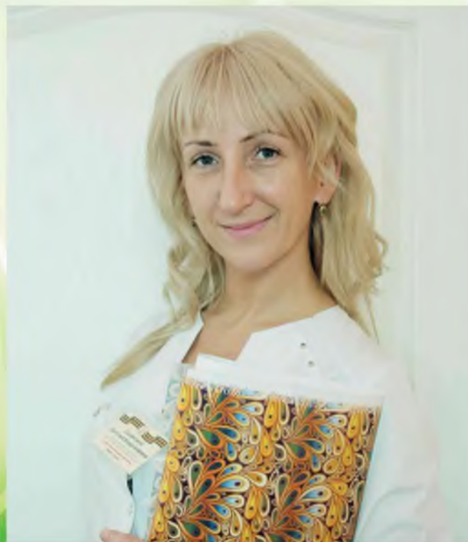
На операционный день косметики не хватает

От того, как ты выглядишь, зависит настроение. От работы нужно получать чувство морального удовлетворения, и только тогда ты будешь в отличной форме.