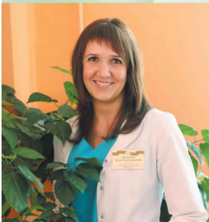
На работу как на праздник

Сегодня представлен широкий выбор медицинской одежды, на которую тоже есть своя мода. Со временем мода меняется, сейчас в тренде – костюмы, которые подчеркивают индивидуальность. Белый халат – это классический вариант, но его тоже никто не отменял. Главное, чтобы одежда была красивой, а обувь – удобной.