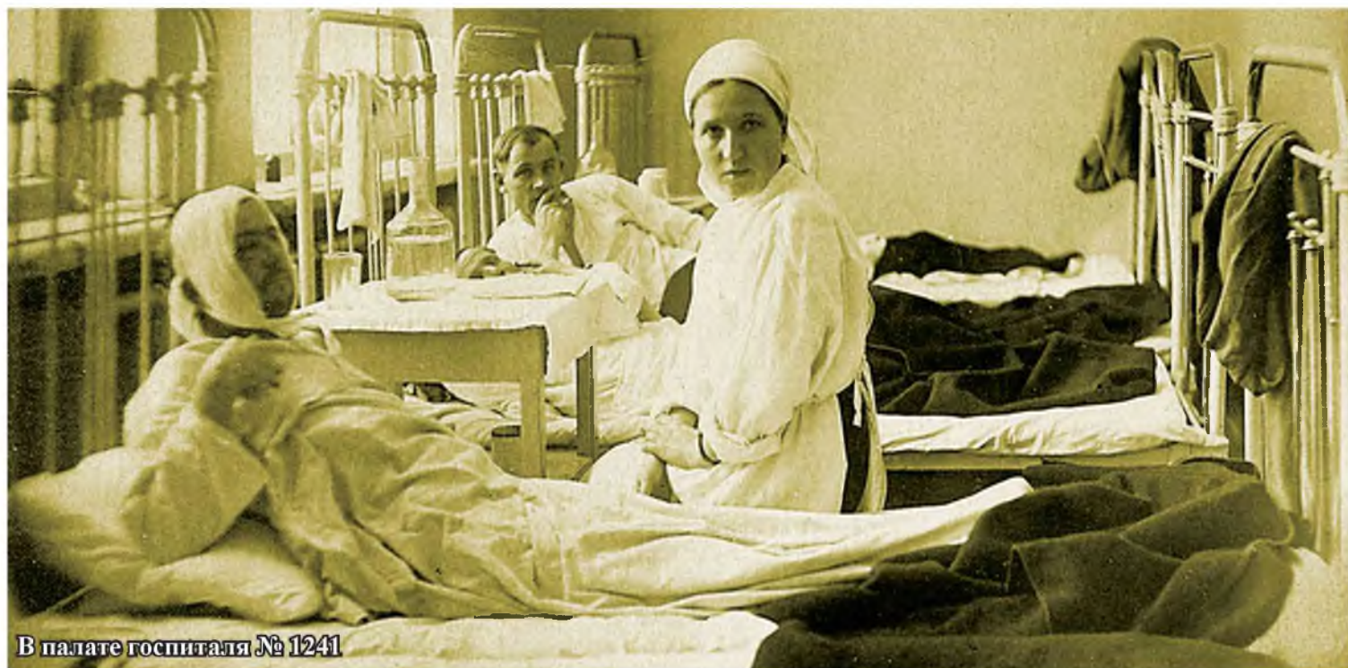
В палате госпиталя № 1241

Для обслуживания рабочих КМК был оставлен один корпус на 100 коек. В одном бараке разместились травматологи, хирурги и офтальмологи. В связи с мобилизацией врачей в армию заведование отделениями переходило