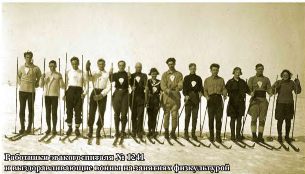
Работники эвакогоспиталя № 1241 и выздоравливающие воины на занятиях физкультурой

О работе эвакогоспиталя № 1241 в г. Сталинске