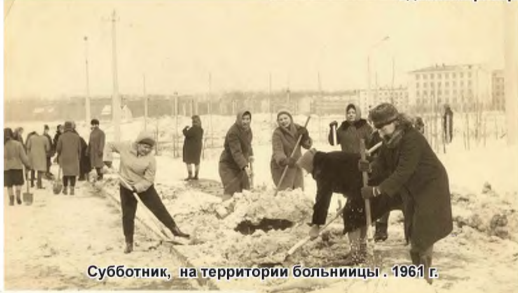
Субботник, на территории больницы. 1961 г.