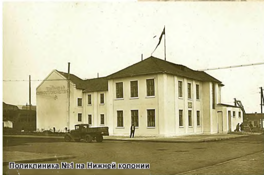
Поликлиника №1 на Нижней колонии

Людмила Фойгт, заведующая музеем истории ГКБ №1.