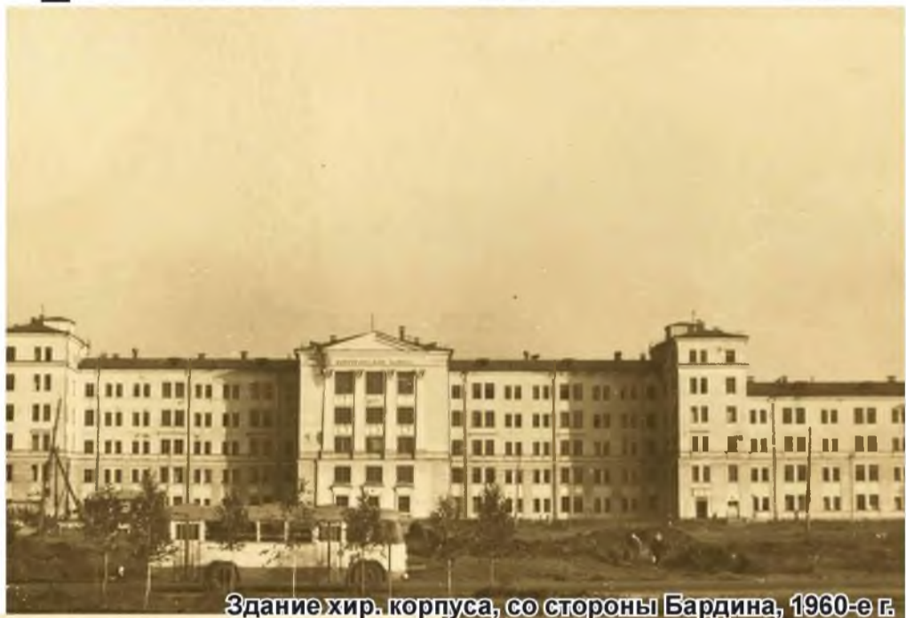
Здание хир. корпуса, со стороны Бардина, 1960-е г.

перевод из Новосибирска в г. Сталинск учебного и научного учреждения Государственного Института для усовершенствования врачей (ГИДУВа). Население города Сталинска к 1951 году увеличилось до 277,2 тысячи человек. Его промышленный потенциал резко вырос. В связи с этим количество производственных травм и болезней профессионального характера увеличилось. Между областным городом Кемерово и промышленным центром Сталинском за проезд ГИДУВа началось противоборство, которое закончилось в пользу Сталинска. Решить эту слож-