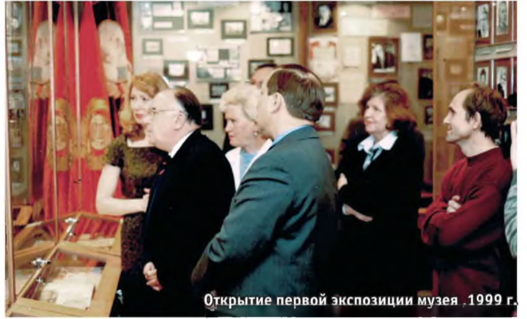
Открытие первой экспозиции музея. 1999 г.

Основой любого музея для создания комплек-