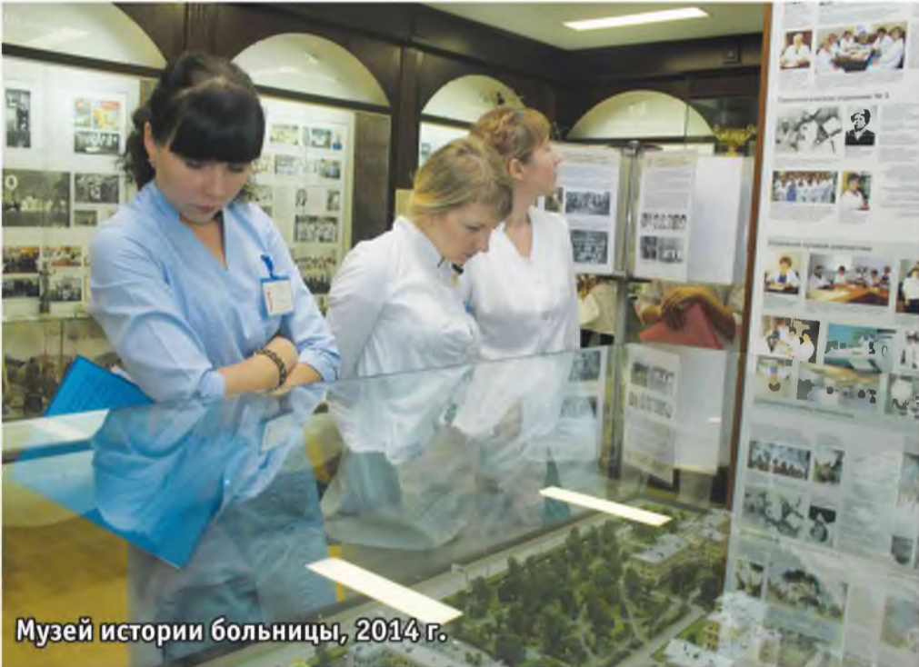
Музей истории больницы, 2014 г.

году зал Трудовой Славы был открыт. Он просуществовал до 1999 г. К сожалению, экспонаты зала трудовой славы до нашего времени не дожили. Утрачены спортивные кубки, вымпелы, подарки. Все они растворились во времени, но зато остался большой целлофановый пакет с фотографиями, знамена, книга по истории больницы.