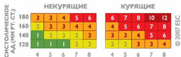
ОБЩИЙ ХОЛЕСТЕРИН ШКАЛА ОТНОСИТЕЛЬНОГО РИСКА

Для людей моложе 40 лет рекомендуется пользоваться Шкалой относительного риска. Шкала используется безотносительно пола и возраста человека и учитывает три фактора: систолическое (верхнее) артериальное давление, уровень общего холестерина и факт курения. Технология ее использования аналогична таковой для основной Шкалы SCORE.